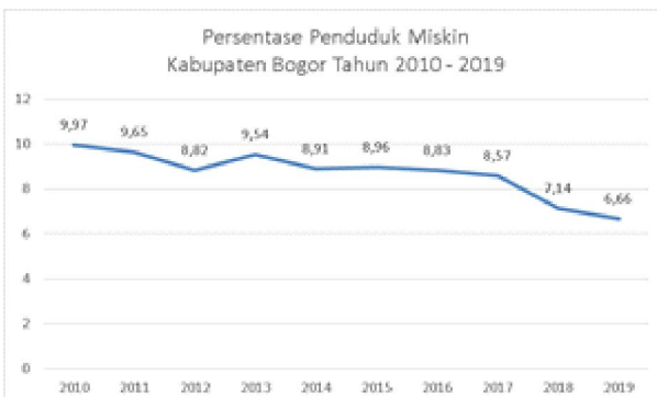
Persentase Penduduk Miskin Kabupaten Bogor Tahun 2010 – 2019